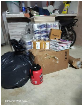
HONOR 200 Smart